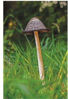
Bild: Schopftintling

Im Frühling konnten dieses Jahr Morcheln oder Maipilze gefunden werden. Durch die äusserst feuchte Witterung waren Maronen- und Rotfuss-Röhrlinge nicht sehr häufig. Ebenso der sonst häufige Flockenstiellige Hexen-Röhrling konnte sich mit dieser Feuchtigkeit nicht anfreunden. Weitere häufige Speisepilze waren Eierschwämme und Riesenschirmpilze. Besonders häufig waren Semmelstoppel, Herbsttrompeten und Schleiereulen ( Cortinarius praestans ). Feld-Champignons konnte man nicht viele finden. Es war zu nass. Auch der Schopf-Tintling als Pilz des Jahres 2024 kam heuer nur in wenigen Exemplaren zum Vorschein, wo sonst ganze Teppiche die Wege säumen.